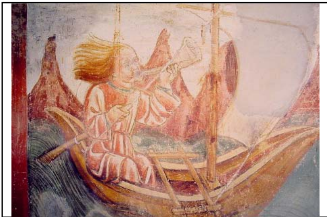
Palagnedra (TI), A. da Tradate, ca. 1490